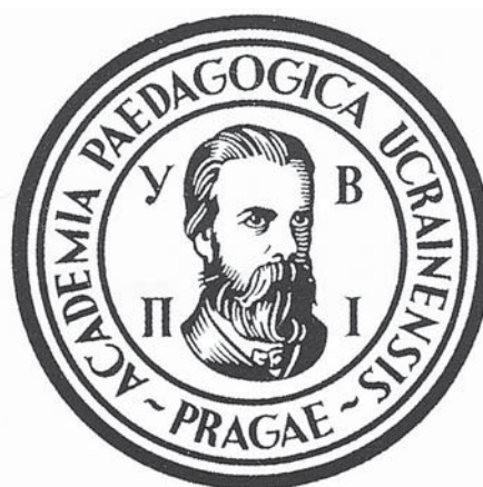
Емблема Українського вищого педагогічного інституту ім. М. Драгоманова у Празі

нижчих класів гімназій та інших рівнозначних шкіл, для викладання загальноосвітніх предметів у середніх технічних закладах і спеціалістів із педагогічної, виховної та адміністративної роботи в освітніх установах [13, арк. 38—39]. Інститут у складі трьох відділів — історико-літературного, фізико-математичного та природо-географічного (згодом було створено ще й музично-педагогічний відділ, а фізико-математичний і природо-географічний об'єднано у математично-природничий), став «лабораторією потрібних для України діячів науки, українських педагогів — громадян, що об'єднували в собі глибоку національну свідомість, широкий ідейний розвиток та повноту фахових знань» [14, арк. 2].