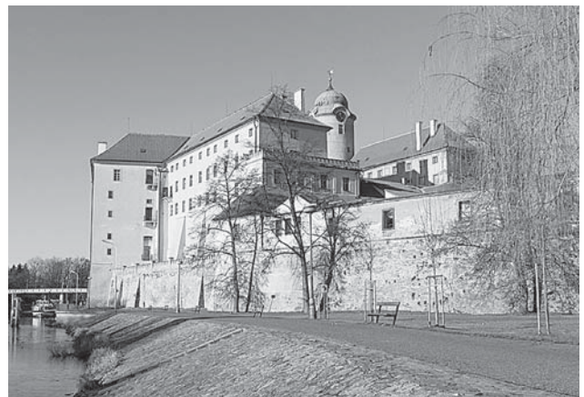
Подєбрадський замок. У його стінах протягом 1920—1930-х рр. розташовувалася Українська господарська академія

У 1920-х рр. тут діяло кілька українських потужних освітньо-наукових установ: 1921 р. з Відня до Праги було перенесено Український вільний університет, 1922 р. відкрито Українську господарську