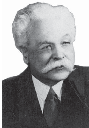
Никифір Григоріїв (1883—1953)

з чеським урядом та неурядовими організаціями, надавав українцям (незалежно від їхніх політичних симпатій) всю необхідну для біженців допомогу — від фінансової та медичної до працевлаштування та здобуття освіти.